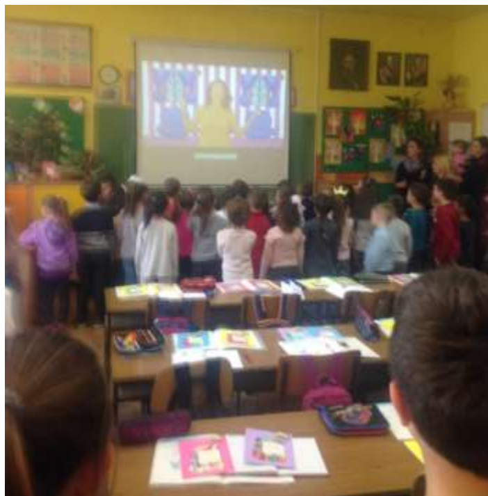
Плесали смо заједно!!!